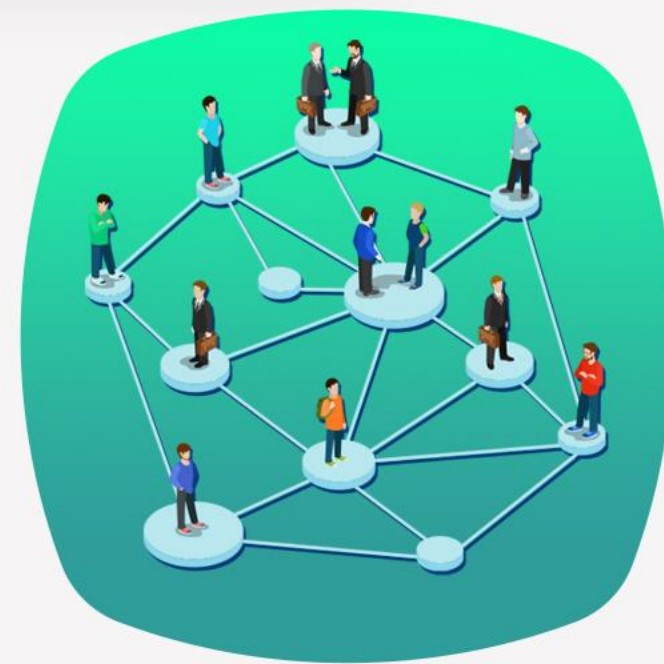
شبکه افراد و همکاران